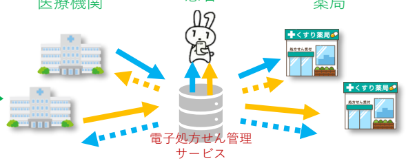
電子処方せん管理サービス

お薬の情報を電子データで登録し蓄積します。次回受診時に電子処方せん対応施設はお薬情報の確認ができます。